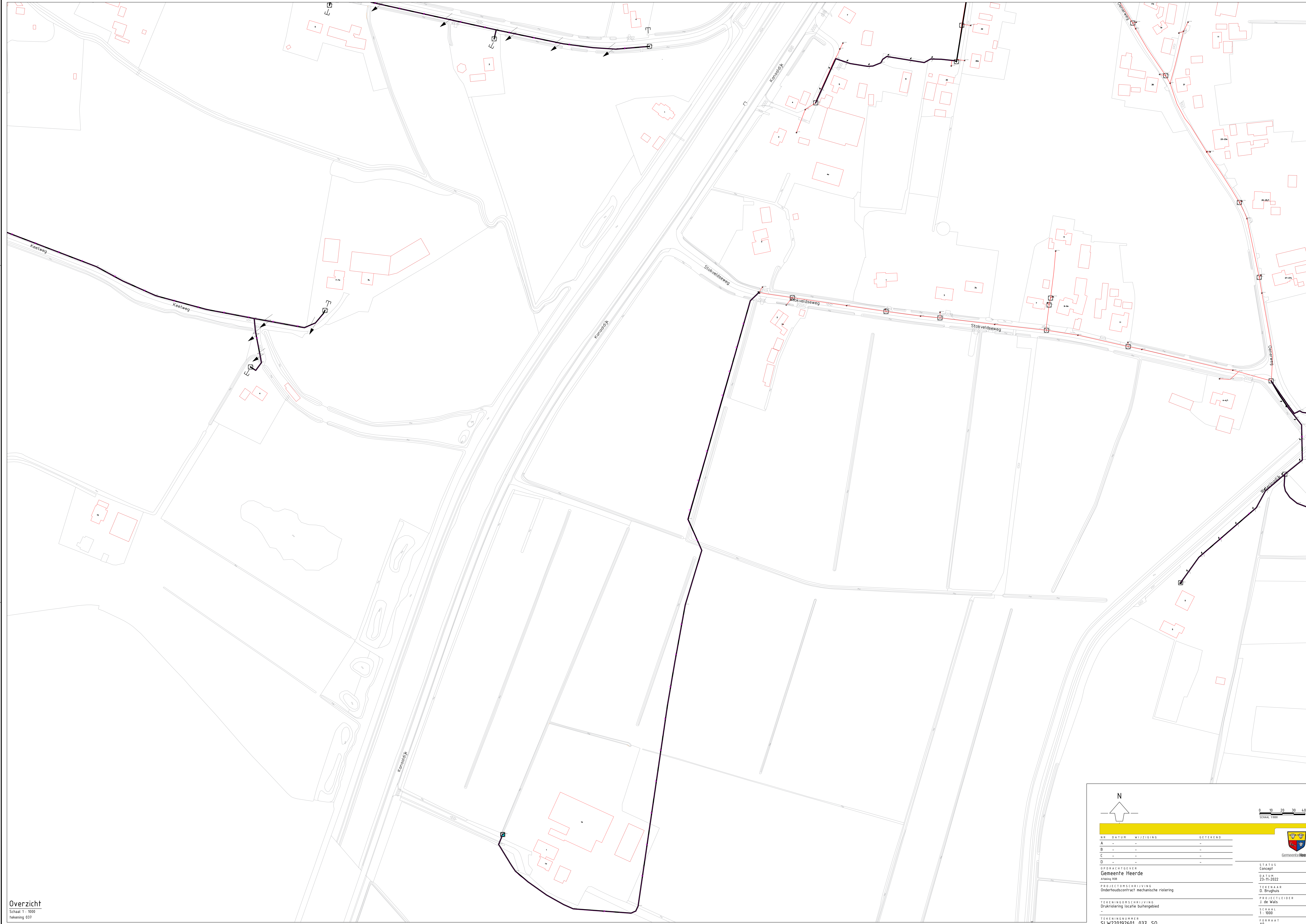
Overzicht Schaal 1: 1000 Tekening 037